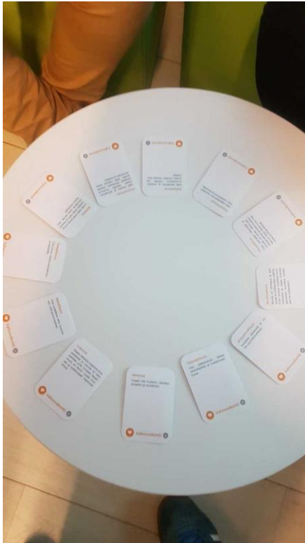
Kuva 1 Opiskelijoita vahvuuskorttiensa äärellä.