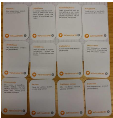
Kuva 2 Toisen opiskelijaryhmän vahvuuskortit